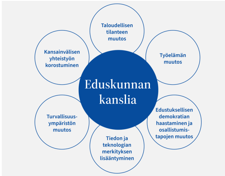
Kuvio 1: Eduskunnan kanslian toimintaympäristön muutostekijät

Suomen taloudellisen tilanteen ja etenkin julkisen talouden tilanteen kiristyminen asettaa raamit kanslian toiminnalle. Myös kanslian on omassa toiminnassaan otettava huomioon valtiontalouden haasteet. Samaan aikaan kanslian menoihin tuovat korotuspaineita inflaation myötä kallistuneet tavara- ja palveluhankinnat, kiihtynyt palkkamenojen kasvu sekä toimintaympäristöstä nousevat uudet tarpeet. Rajalliset resurssit korostavat entisestään toiminnan priorisointia sekä rahallisten- ja henkilöstöresurssien tehokasta ja tarkoituksenmukaista käyttöä.