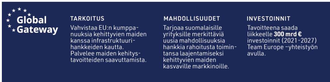
Kuvio 4. Global Gateway -strategia.